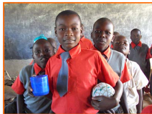
Trots met bal en beker

Mocht dit echter niet mogelijk zijn, dan wordt gezocht naar sponsors/bedrijven die ons willen helpen.