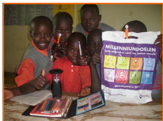
Trots en blij met de nieuwe mapjes