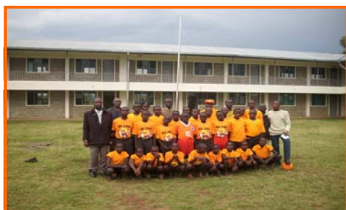
De twee voetbalteams van de school