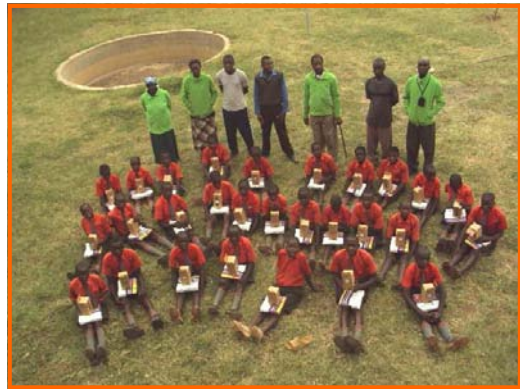
Alle 29 kinderen met de mapjes en solar lampjes

Helaas hield de douane de pakketten voor nadere inspectie ruim vier weken vast in Nairobi, zodat het geduld van iedereen behoorlijk op de proef gesteld werd.