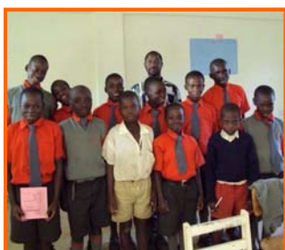
Klas 5 SCPBS

Ik kijk terug op een geslaagd projectbezoek. Wij hopen met SBS nog lang steun te kunnen bieden aan deze fantastische kinderen.